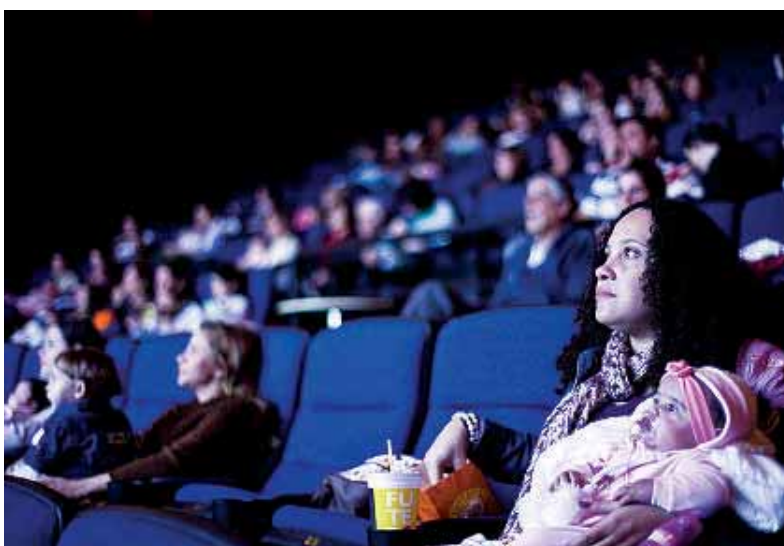
A sessão inicial do CineMaterna , em Manaus, tem como opções para votação, no site, os filmes 'Meu passado me condena' e 'Blue Jasmine'

No dia 21 de novembro, a sessão de estreia será gratuita e reunirá apenas as pessoas