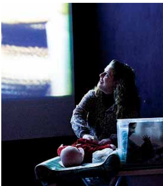
Os trocadores são estrategicamente posicionados de frente para a tela